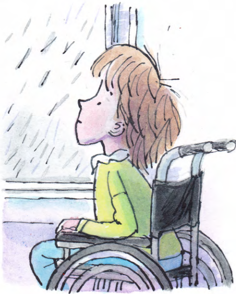
Rhaid iddo fe wisgo cot law.

Answer in full sentences, using the correct form of 'i' (iddo fe/ iddi hi etc). The first one has been done for you.